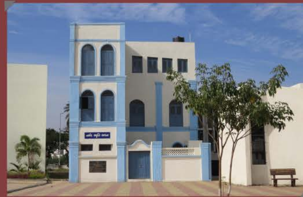
Narmad Smruti Bhavan