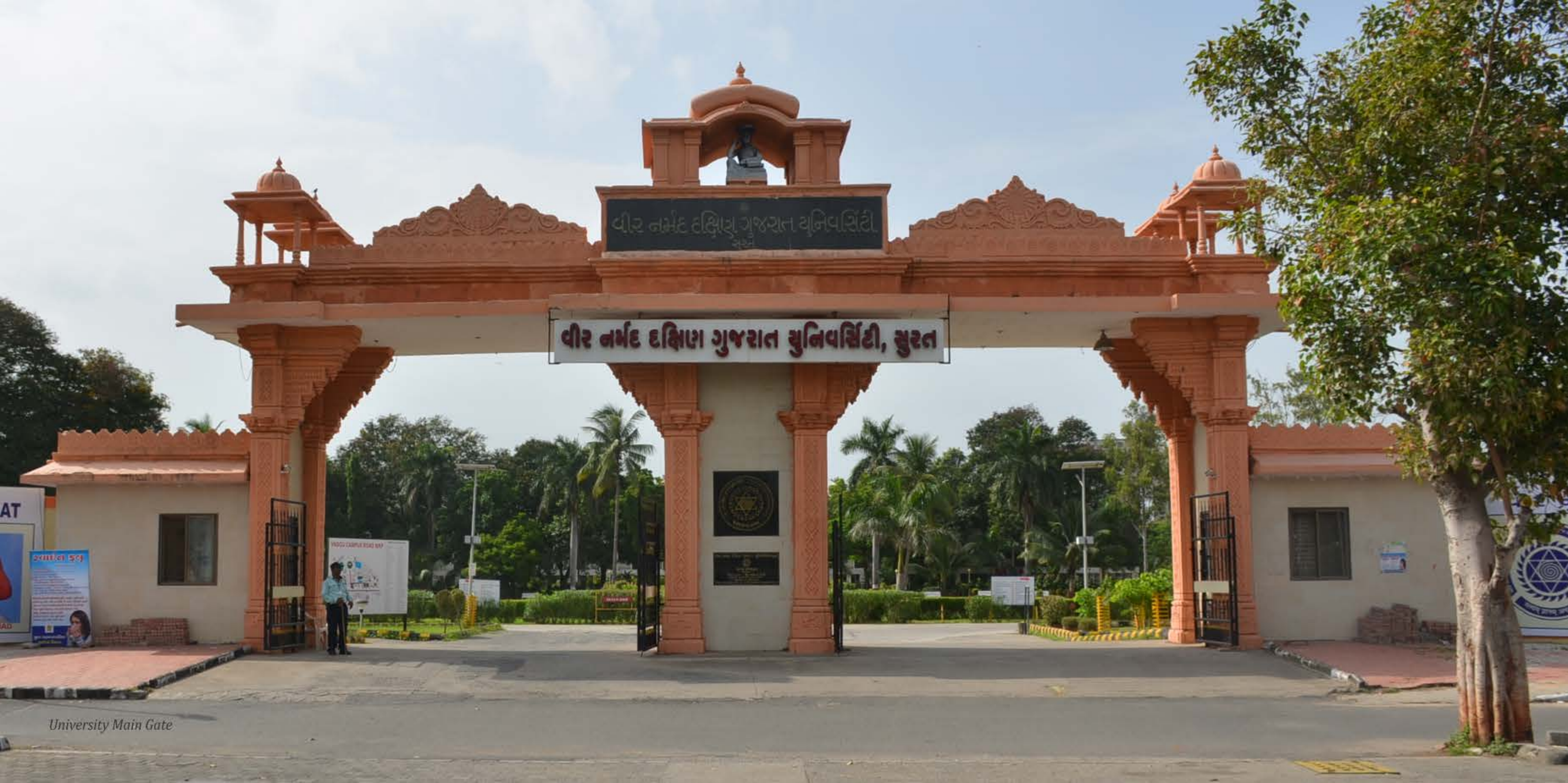
University Main Gate