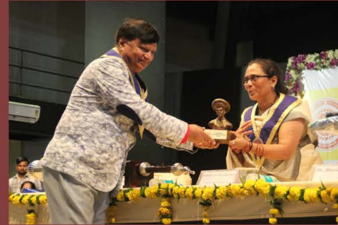
FELICITATING THE CHIEF GUEST