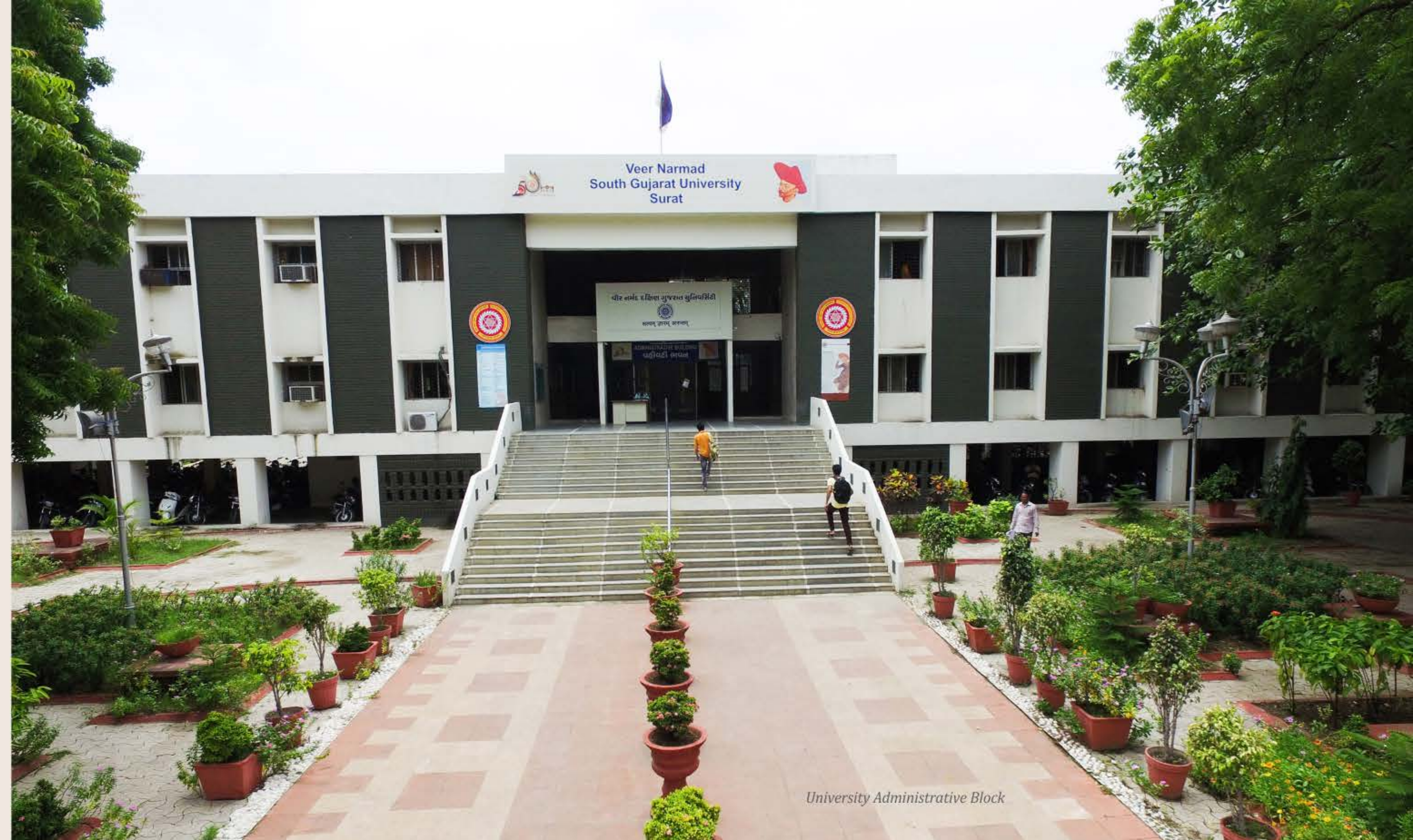
University Administrative Block